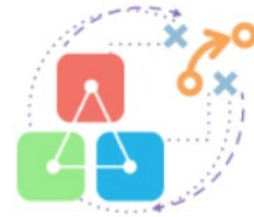
Entscheidungsmanagement und Implementierung