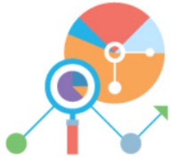
Statistische Analyse und Berichterstellung