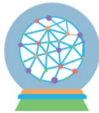
Vorausschauende Modellierung und Data-Mining